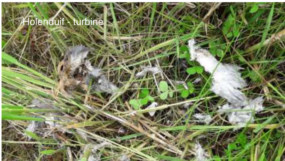
Holenduif - turbine