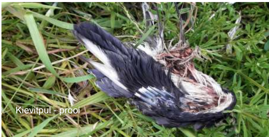
Kievitpul - prooi