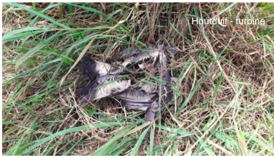
Houtduif - turbine